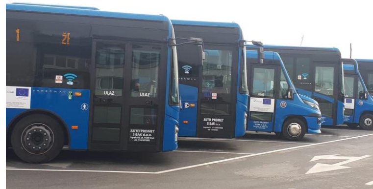
Slike: novi autobusi za Auto promet Sisak d.o.o.