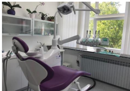
Slika: nabavljena oprema u okviru projekta „Opremanje ordinacije primarne zdravstvene zaštite na području SMŽ“