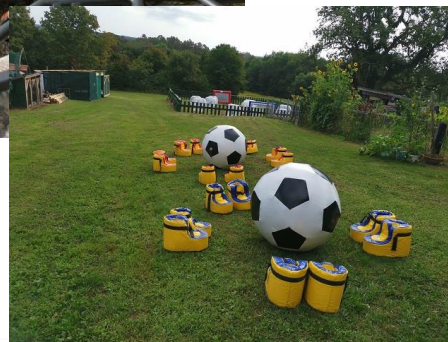
Slike: nabavljena oprema u okviru projekta „Adrenalinska avantura na području Banovine“