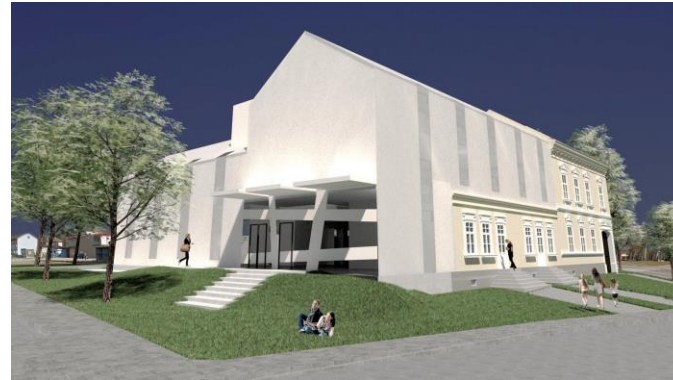
Slike: stanje prije obnove i idejno rješenje za obnovu hotela Knopp