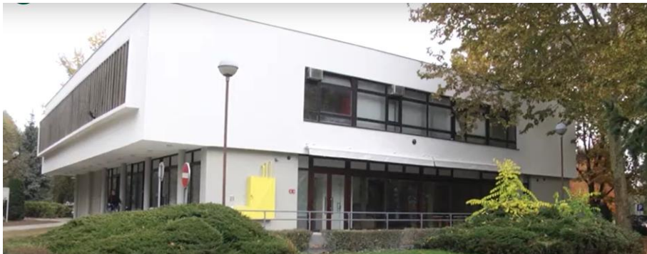
Slika: Poduzetnički inkubator Kutina - PUNK