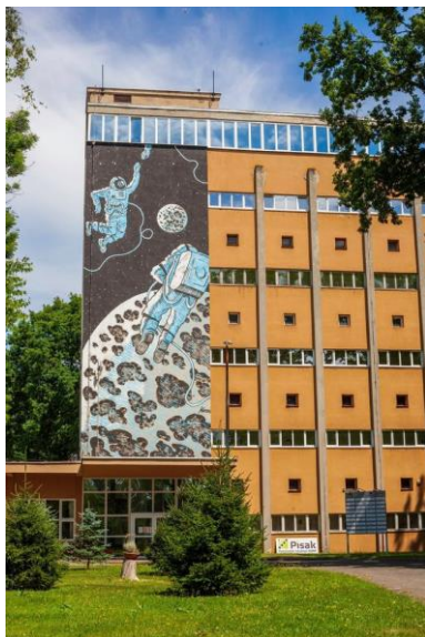
Slika: Poduzetnički inkubator PISAK - Sisak