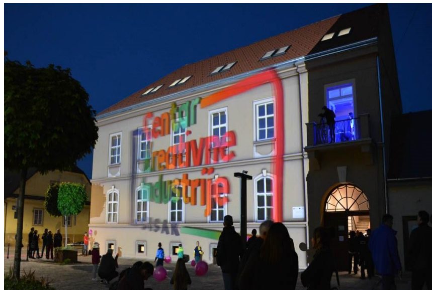
Slika: Centar kreativne industrije/kreativni inkubator Sisak