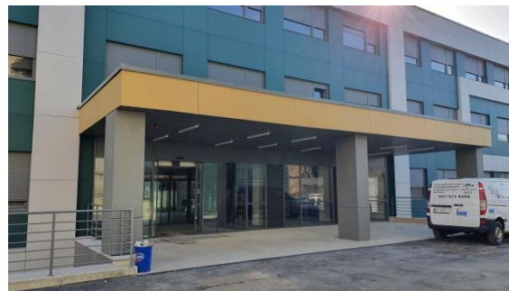
Slika: rekonstrukcija bolničkog kompleksa - Središnji paviljon Opće bolnice „dr. Ivo Pedišić“ Sisak